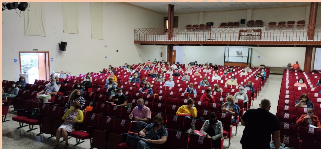
Vista panorámica del salón

La pandemia ha causado el cese de encuentros y la proximidad de la conexión personal, de tú a tú, el cansancio de lo virtual generó que, para los asistentes, el horario de 5 a 8,30 de la tarde de los días 28, 29 y 30 de junio fueran un regalo, una posibilidad de encuentro.